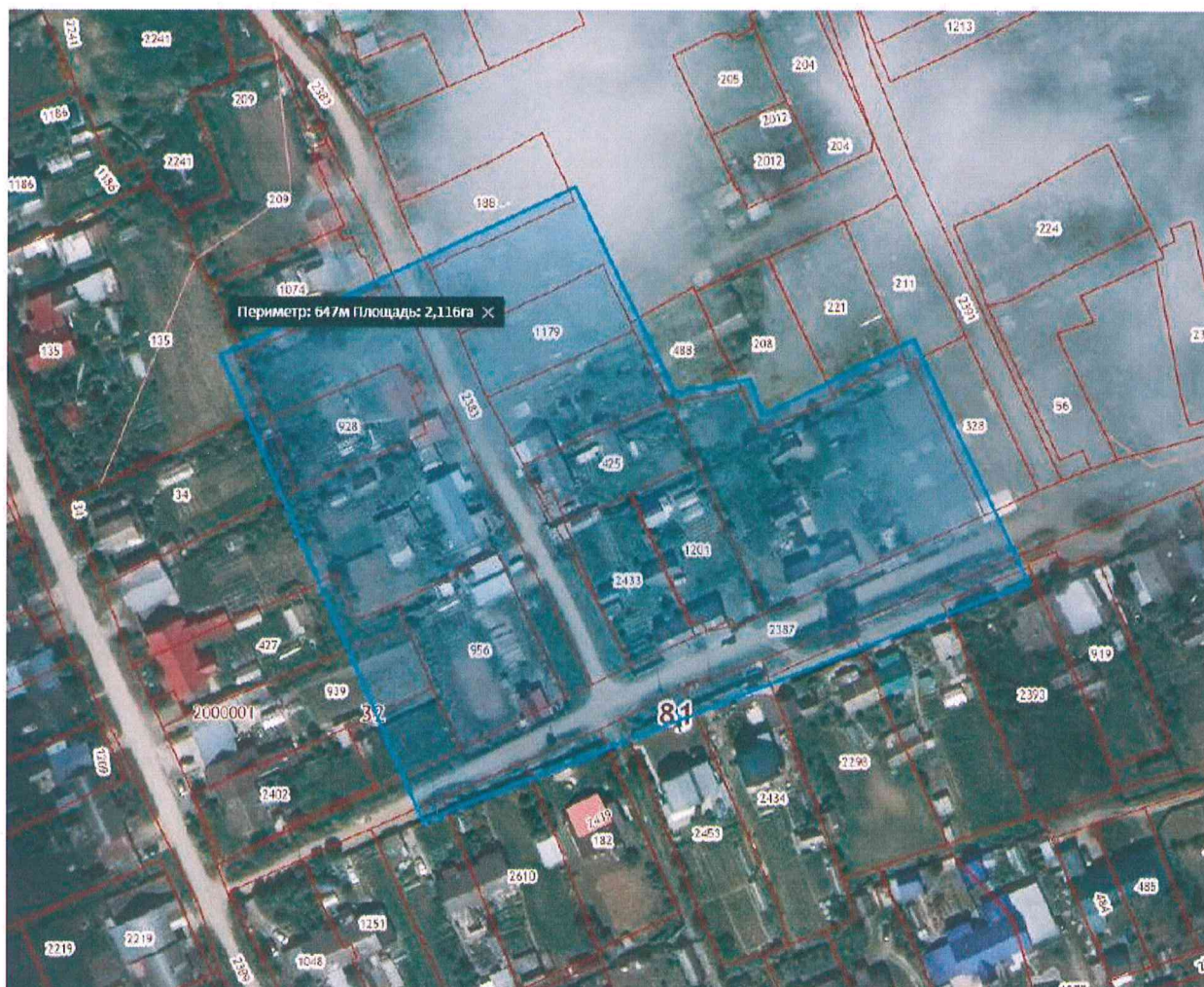
Схема для разработки проекта планировки и проекта межевания части территории п. Красный Восход Усть-Качкинского сельского поселения Пермского муниципального района Пермского края, включающей дома № 4 и № 5 по ул. Молодежная и № 8 по ул. Полевая